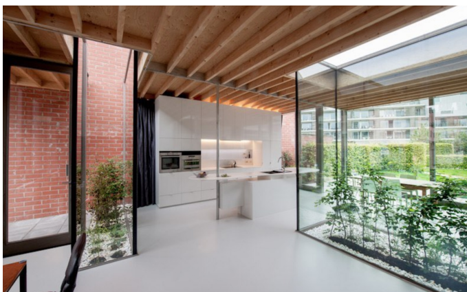
© Steven Massart - Bamboo House

Ons eigen huis is in 2002 gebouwd, wat een van onze vroege projecten was. Ik merk toch dat daar al veel kwaliteiten inzitten die ik nog steeds probeer na te streven in latere projecten. Een voorbeeld van waar we dat hebben kunnen realiseren, is het Bamboehuis.