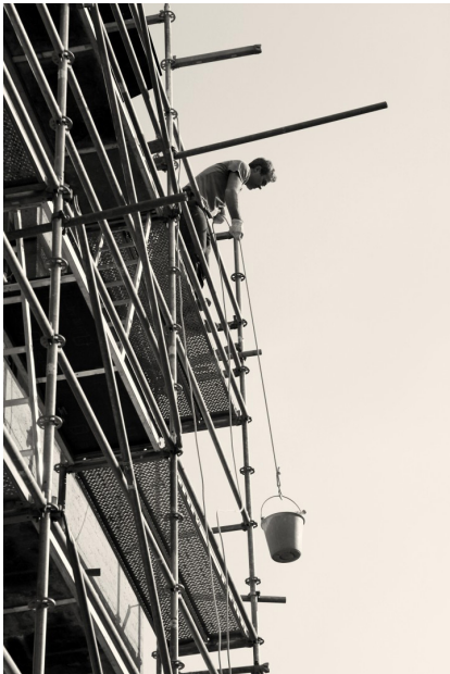
© DMOA - ambacht bij de bouw van eigen kantoor

We proberen die ambacht te combineren met moderne technologie tot iets wat vandaag nog realiseerbaar is.