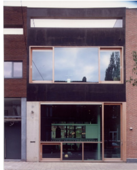
Woning en praktijk GOAHQ

Volgens mij is dat ook de rol van een begeleider. Je moet proberen niet te dwingend te zijn. Daarom toon ik ook veel referenties en leg ze uit. Dan geef je al een soort vertaling en hefboomen van hoe daar is nagedacht in zo'n ontwerp. Het verhaal dat je rond een ontwerp vertelt is namelijk ook van groot belang. Je zou me zelfs een David Chipperfield kunnen verkopen bij wijze van spreken. Ik zou nooit zelf ontwerpen in die architectuurtaal, maar dat neemt niet weg dat daar aantoonbare kwaliteiten in kunnen zitten.